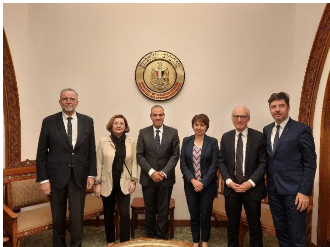
La délégation avec M. Badr Abdelatty, ministre des affaires étrangères

L'offensive d'Israël au Liban, à Gaza et désormais en Cisjordanie risque de placer les autorités égyptiennes , comme au demeurant les autorités jordaniennes, dans une position intenable auprès de leurs opinions publiques . Celles-ci demeurent très sensibles à la cause palestinienne . Il devient de plus en plus difficile de justifier la coopération avec Israël alors que la Knesset a rejeté le principe d'un État palestinien, que