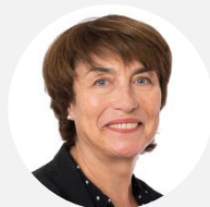
Marie-Pierre de La Gontrie

Sénatrice (Socialiste, Écologiste et Républicain) de Paris