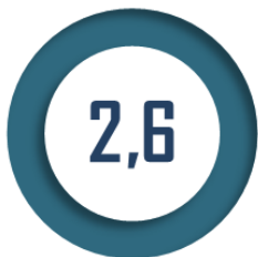
Lits pour 1 000 habitants au Danemark

La réforme de 2007 a surtout assumé la redéfinition de la place de l'hôpital au Danemark, avec le choix fait d'un recours à l'hôpital réservé aux actes techniques qui le nécessitent et pour la seule durée requise.