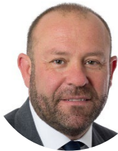
Philippe Mouiller Sénateur (LR) des Deux-Sèvres Président