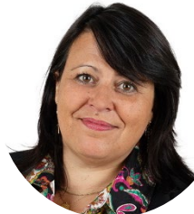
Anne-Sophie Romagny Sénateur (UC) de la Marne