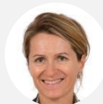
Anne-Catherine Loisier Rapporteuse du groupe de suivi des lois « Egalim » Sénatrice (Ratt. Union Centriste) de la Côte-d'Or