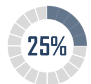
Taux de contractualisation dans la filière bovine

La contractualisation écrite, bien que généralisée par Egalim 2, reste faiblement appliquée. Au sein des filières soumises à l'obligation, c'est-à-dire la quasi-totalité des productions animales, la contractualisation est peu développée - hormis dans la filière laitière pour des raisons historiques. Dans la filière bovine , où elle a été généralisée à partir de 2022, le taux de contractualisation est passé de seulement 17 % en 2022 à 25 % fin 2023 . De plus, de nombreuses filières sont exemptées, par voie réglementaire, de l'obligation de contractualisation écrite : productions végétales, fruits et légumes, vins, apiculture... Par ailleurs, bien que fournissant une base de discussion ainsi qu'un référentiel fiable et objectif de nombreux indicateurs de référence ne sont pas publiés par les interprofessions.